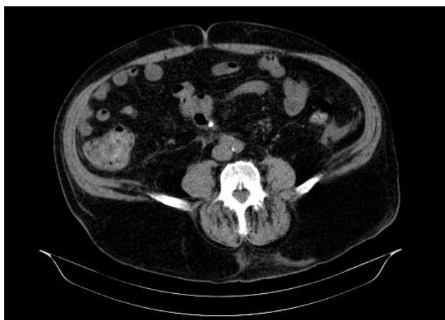
Fig. 2- TC abdomen con prótesis plástica (punto blanco) en pared de sigma.

Se realizó TC abdominal apreciándose neumoperitoneo en hemiabdomen superior, con líquido libre perihepático y en ambas gotieras paracólicas, y neumobilia. La prótesis metálica se encontró correctamente situada en colédoco distal y la prótesis de plástico, de aproximadamente 10 cm de longitud apareció alojada en sigma, perforándolo a ese nivel y atravesando el mesenterio (Fig. 2).